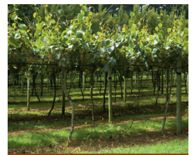
مرحله: بعد از برداشت