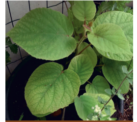
مرحله: آغاز رشد رویشی