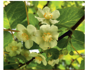
مرحله: بعد از گلدهی

آ لگورا آرامیکس هاسمیک+ کلسیم آریا ویوگر میکس